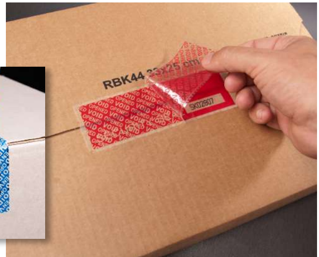
SK 77 SN 全轉