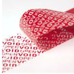
SK 81 半轉