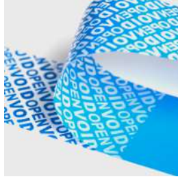
SK 84 全轉