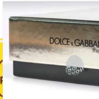
SK 6807 Clear 不轉