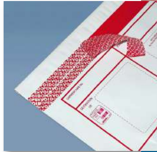
SK 20 半轉

作為國際民用航空組織(ICAO)認可生產的安全防啟封袋(STEB)的主要供貨商，我們提供一系列高質量的防篡改膠帶和膠膜以滿足您特定的需求，如運輸現金、文件和貴重物品。這些膠帶提供切實可行的安全解決方案，在各個領域的行業和市場，如金融、銀行、航空公司、現金處理、物流和快遞服務。